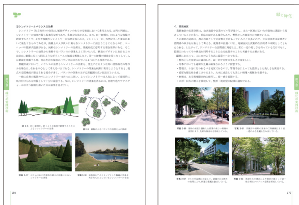
< 誌面のイメージ >